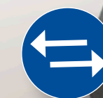
Vafri genomförningsriktning (kräver tilläggsutrustning)